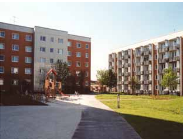
Ohrdruf / Thüringen: Vorgehängte Keramik-Fassade EURACON KH-610