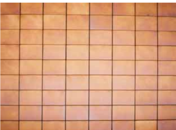
Ohrdruf / Thüringen: Vorgehängte Keramik-Fassade EURACON KH-610

Bei dem Fassadensystem EURACON KH-610 handelt es sich um eine vorgehängte, hinterlüftete, wärmegeämmte Steinzeug-Keramik-Fassade bestehend aus schlagfesten Keramik-Fassadenplatten auf Aluminium-Unterkonstruktion unter Verwendung mineralischer Dämmstoffplatten.