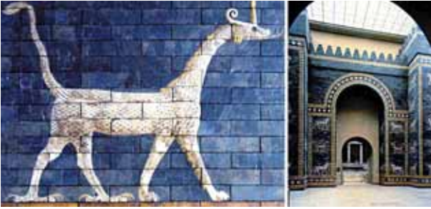
Die Stadtmauer von Babylon ca. 2600 Jahre alt – aus Keramik

Die vorgehängte, hinterlüftete und wärmege- dämmte Steinzeug-Keramikfassade Euracon KH- 610 ist ein hochinnovatives Fassadensystem. Mit modernster Technik werden im Crinitzer Keramik- werk nach traditionellen Fertigungsmethoden hochwertige Steinzeug-Keramikplatten hergestellt.