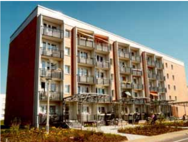
Ohrdruf / Thüringen: Vorgehängte Keramik-Fassade EURACON KH-610